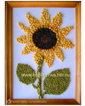
Ejemplo de cómo quedará